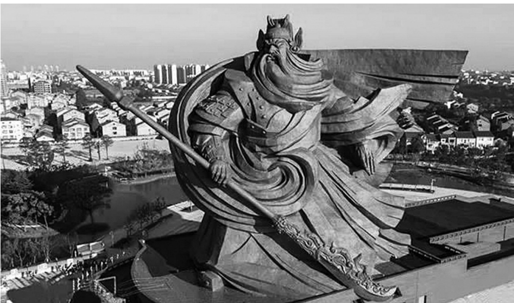
湖北省荆州市在古城历史城区范围内建设的巨型关公雕像,高达57.3米,违反了经批准的《荆州历史文化名城保护规划》有关规定,破坏了古城风貌和历史文脉。

昨日上午,荆州市政府新闻办发布消息称,目前该市已组织邀请专家,依法依规、科学制定搬移方案。