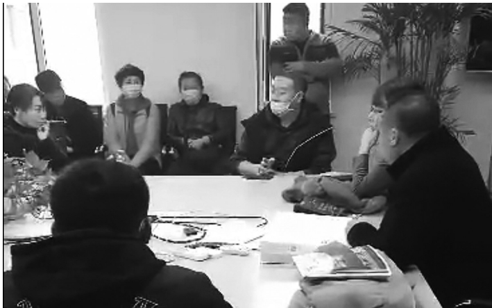
业主到售楼处维权。