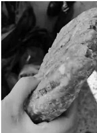
过期发臭的肉馅。视频截图 监督。经查,该食堂食品从业人员6名,均取得有效健康证;食品留样柜48

针对食堂食品安全问题,区市场监管局执法人员对食品加工区域进行了现场检查,同时带3名家长代表全程