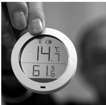
昨日下午，沈阳御苑新 住户王先生家北屋的室温还不足15度。

“我们御苑新邨分东区和西区，我家这个楼在东区。这个楼建于1997年，至今没有分户供暖，都是180多平的大户型。我们东区一共就两个楼，3号楼今年供暖期前分了户，大