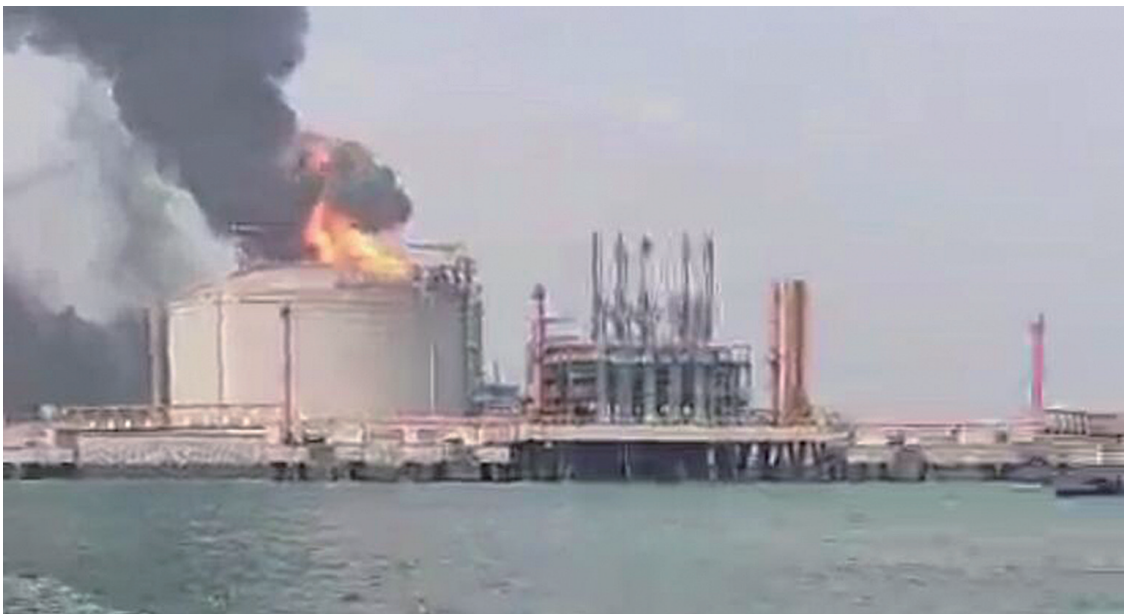
11月2日11时45分左右,铁山港区LNG液化天然气接收站码头内,一LNG储罐顶部蹿起火苗,火势十分猛烈。

11月3日上午,广西北海市人民政府新闻办公室发布通报称,11月2日11时45分左右,国家管网集团北海液化天然气有限责任公司位于铁山港区的LNG接收站码头2号罐,罐前平台管线在发生时发生着火,火势于当天11点55分得到控制扑灭。