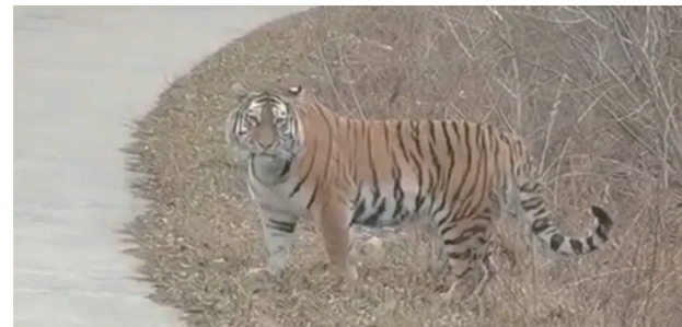
吉林工程师偶遇野生东北虎。

自己的车,突然被路边蹿出来的一只大老虎“盯”上了,还被尾随,挡住去路,是种什么感受?