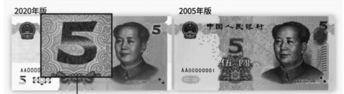
2020年版第五套人民币5元纸币(左图)正面中部面额数字调整为光彩光变面额数字“5”。