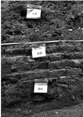
中心里遗址发掘现场可以看到按年代标注的土层标签。

在20世纪初,这里的铜器做工精细、品种繁多,扬名于省内外,这里造出的“奉锣”更是响遍全国。