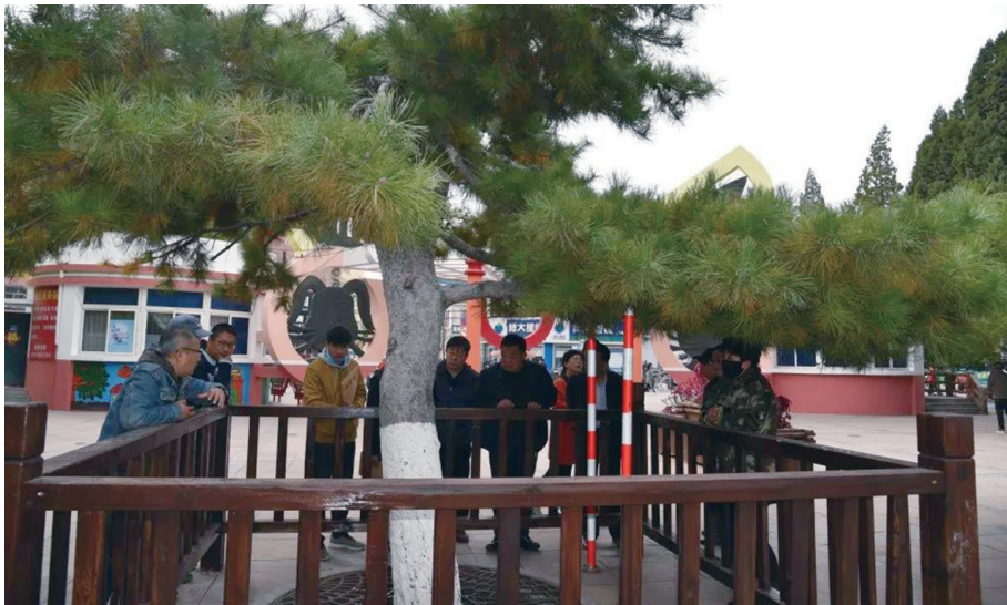
工作人员对古树做日常管护和定期“健康”巡查体检。