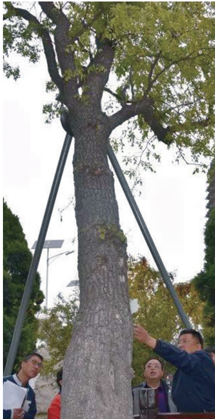
工作人员实地查看古树的健康情况。