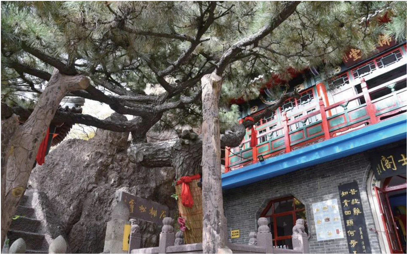
“石棚松雪”景致中的古黑松设置了保护支架。