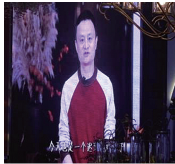
马云为姐妹花录制视频送上祝福。