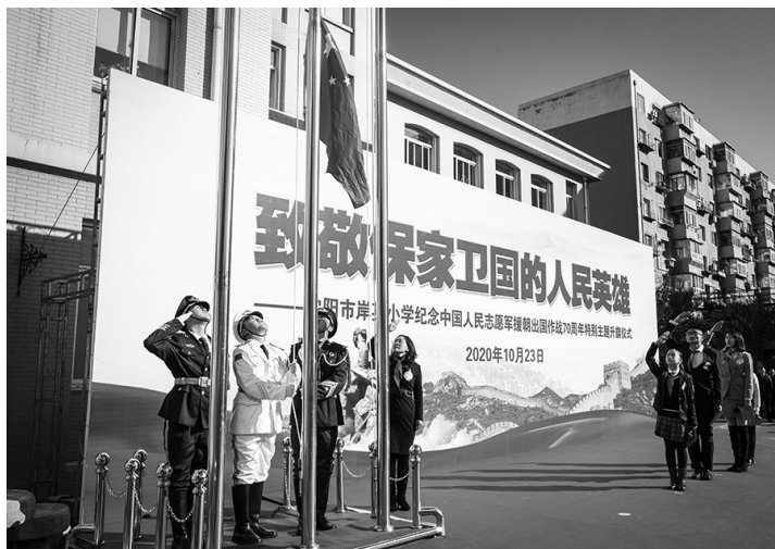
在升旗仪式上,岸英小学的师生们向国旗敬礼。

广告 高血压、冠心病、动脉硬化、糖尿病、脑血栓,为什么这些中老年慢性病,想尽了各种办法,却总是反复呢? 此次发放的鱼油为国家正规产品