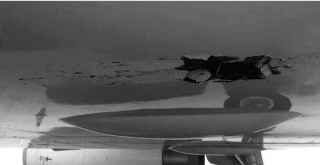
飞机机腹其中一处损伤，贯穿机身。