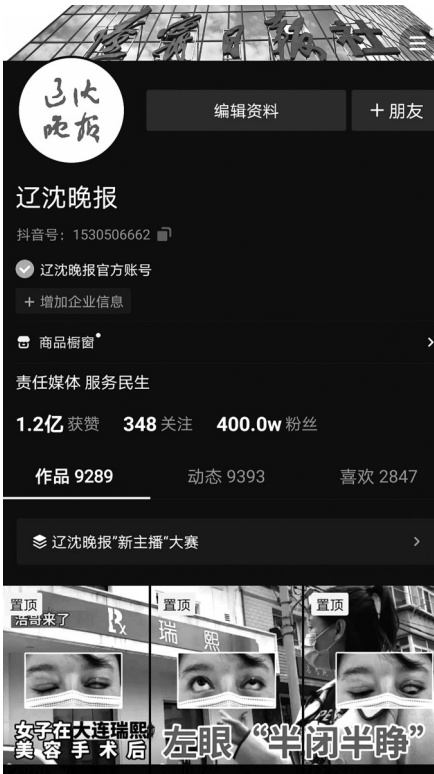
10月20日10时许,辽沈晚报官方抖音号粉丝突破400万。 屏幕截图