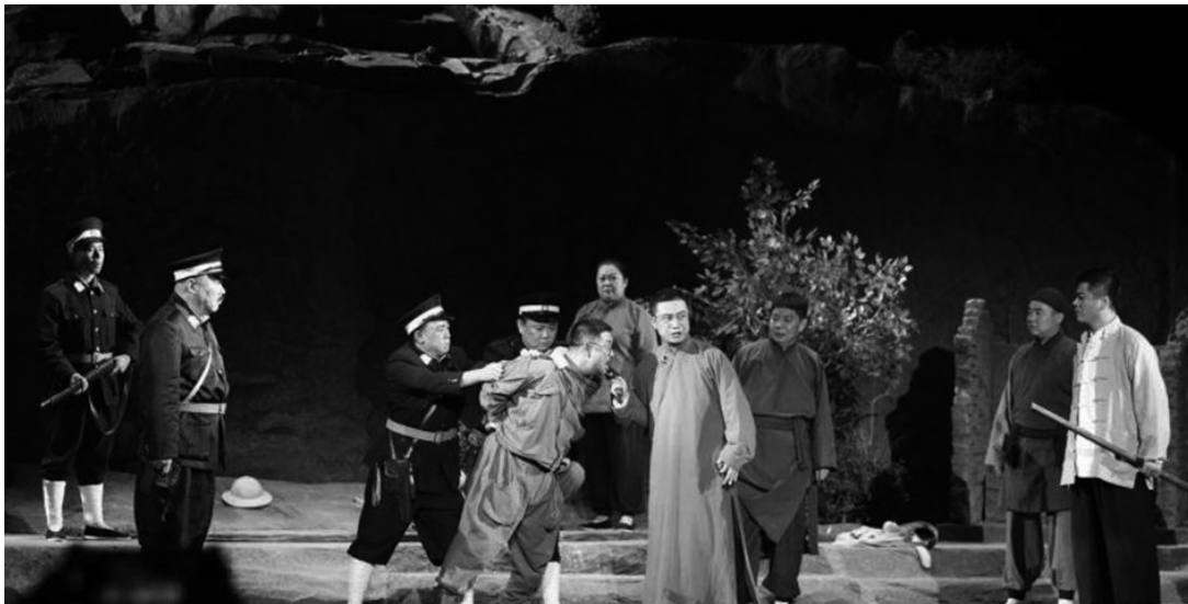
原创大型话剧《血祭龙源》摘下省政府最高奖“文华奖”。

能够在两个多小时的时间里,向观众呈现出如此荡气回肠、极具英雄气概的悲壮剧情,一定离不开整个团