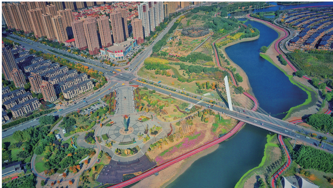
改造后的沈北蒲河沿岸,景致更美,休闲体验更佳。

蒲河沈北新区段东起棋盘山区域,西至于洪区界,长约33.3公里,流域面积约298平方公里。来到沈北,