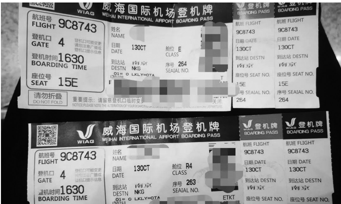
航班的登机牌信息。