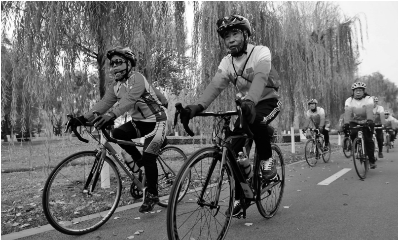
宜人的环境给骑行者提供了舒适的骑行条件。

随着辽宁骑行运动氛围越来越好、骑行人数越来越多,有关骑行的相关大数据也成为热门话题。“黑鸟单车APP”向本报独家提供大数据支持,记者又采访了沈阳市骑行圈颇具名气的12位骑行俱乐部、骑行车队负责人,推出揭秘版辽沈骑行大数据。