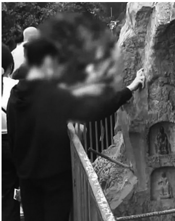
网友拍摄视频显示,在龙门石窟景区内,有游客伸手进入围栏内抚摸佛像。

“此前我们已经有设置文明游览的提示牌,在国庆前还专门开会部署了文明旅游的事情。”上述负责人称,“其实大多数游客还是文明的,国庆期间游客爆满,有人去摸(佛像),可