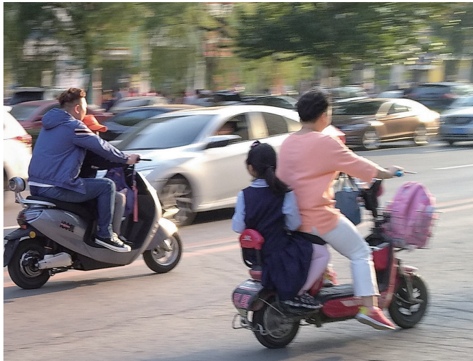
家长和孩子共乘电动车,安全隐患极大。