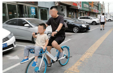
车筐只承重5公斤,这样骑行非常危险。