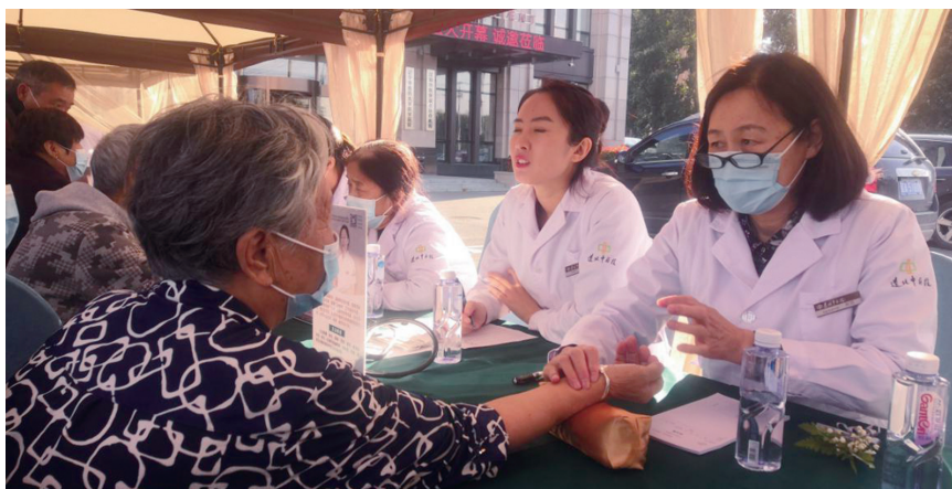
2020年9月19日,由沈阳市沈北新区卫健局主办,辽北中医院、盛经合乐园老年公寓共同承办的“第二届中医药文化节”在辽北中医院隆重举行。

教育在传承中医药文化中具有重要的作用,但是培养具有扎实功底的中医学专业人离不开实践的平台,为了充分发挥学有所用、用其所长、知行合一,辽北中医院为中医药大学的学生提供实践的平台,辽宁中医养生康复学院教学基地在辽北中医院正式落