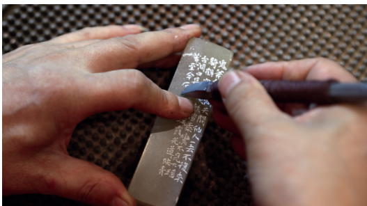
为学生示范印章边款的刻法。