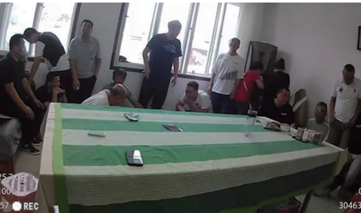
警方一举端掉了这个流动赌博窝点。

经进一步工作，侦查员发现这伙赌徒“打一枪换一个地方”，只赌几局从不长时间恋战，具有很强的反侦查