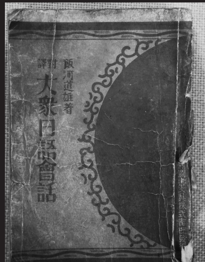
日伪在东北进行奴化教育使用的书籍。