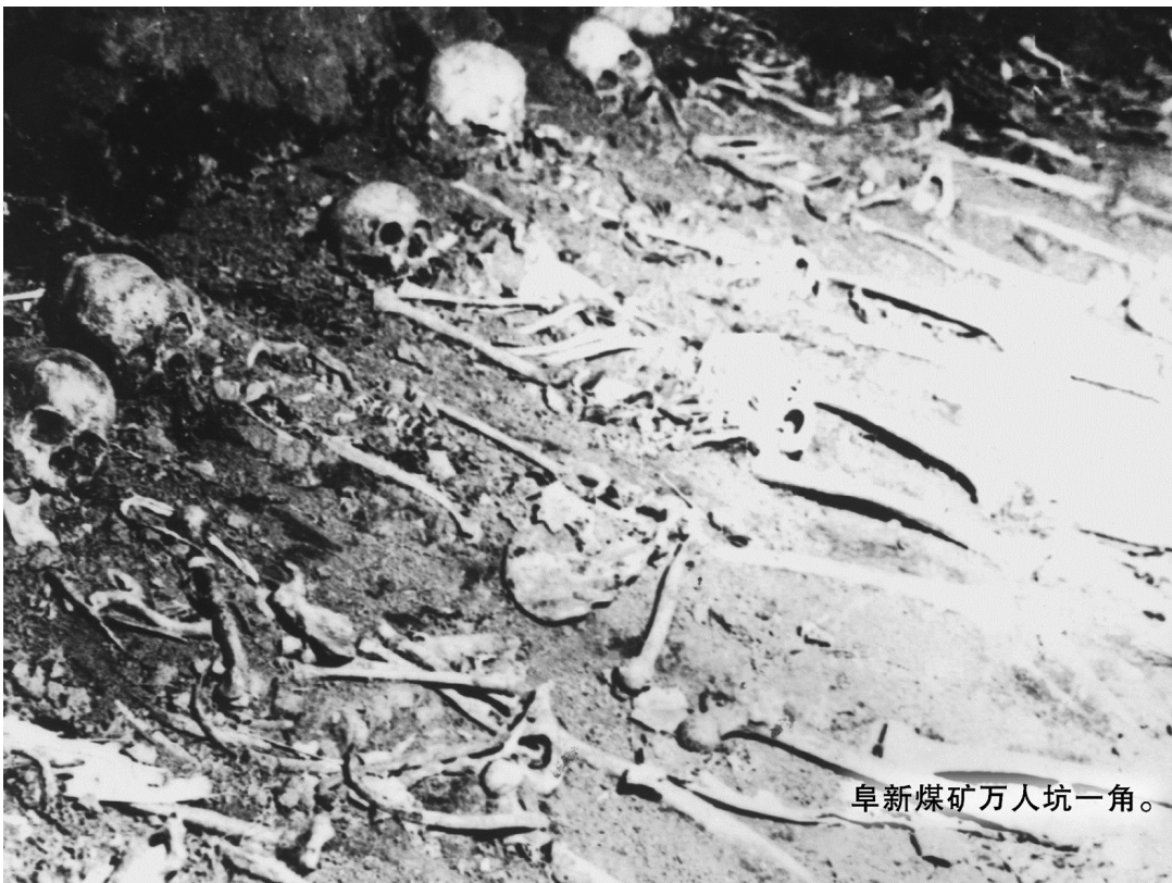
阜新煤矿万人坑一角。