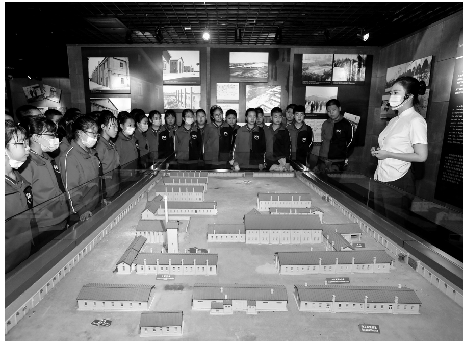
9月3日,大东区和睦路小学学生来到沈阳市二战盟军战俘营遗址陈列馆参观。