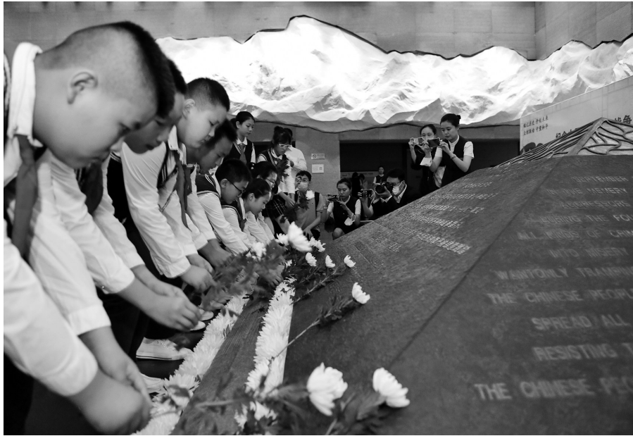
9月3日,“中国人民抗日战争暨世界反法西斯战争胜利75周年主题活动”在沈阳“九·一八”历史博物馆举行,大家向卧碑敬献花束。

活动现场,博物馆为参加“向英雄致敬为英雄献花”铭记活动的观众及学生准备了菊花,大家在纪念日里向寓意着民族英烈浩气长存的卧