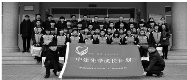
中建二局北方公司志愿服务队。

“奉献一份爱 成就一个梦”是中建二局北方公司志愿者服务队一直以来的团队精神和理念。2016年4月,志愿服务队启动资助辽宁省北票