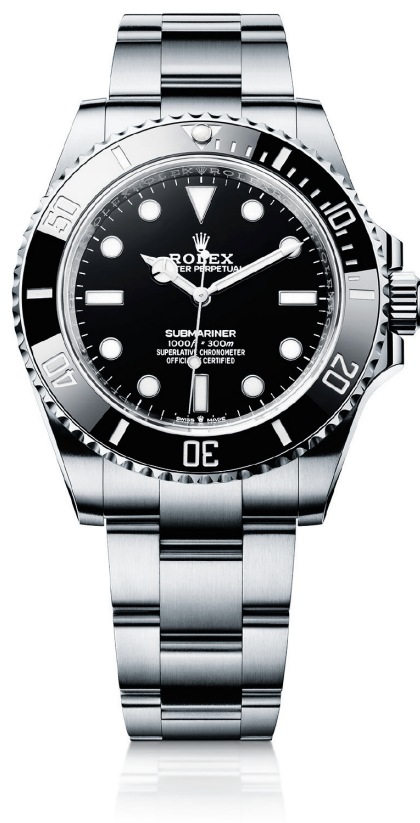
蚝式恒动潜航者型