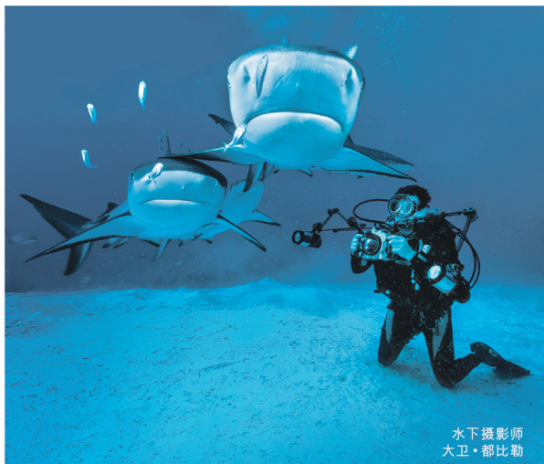
水下摄影师 大卫·都比勒