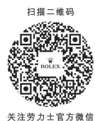
关注劳力士官方微信