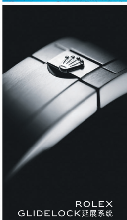
ROLEX GLIDELock 延展系统