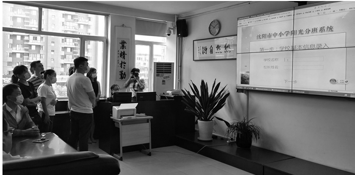
沈阳各区中小学陆续开启“阳光分班”。

来现场的家长代表是如何选出的呢?学校介绍,是随机抽取的,同时要考虑家长的个人意愿,只要工作不忙