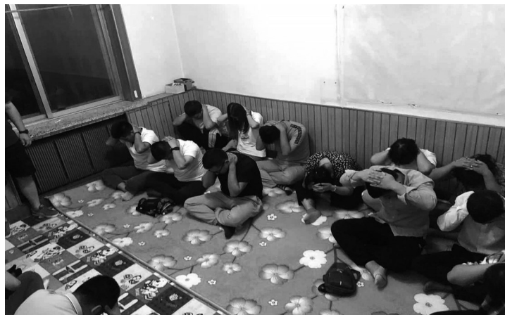
警方端掉犯罪团伙的一个窝点。