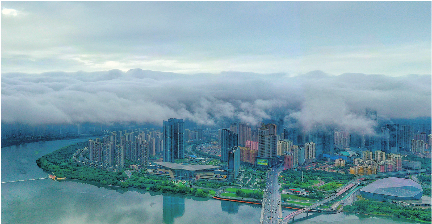
昨日下午5时许,降雨暂歇,沈阳城区上空被水汽笼罩。