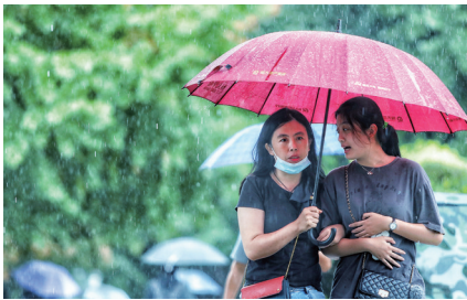
昨日,沈城从早晨就迎来降雨。