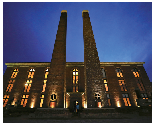
这座老厂区的原貌完整地保留了下来。