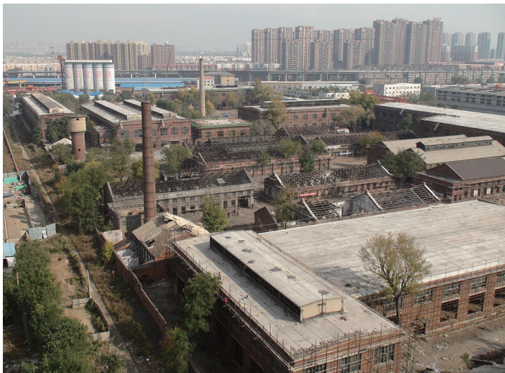
这是修缮改造之前的“奉天工场”老厂房(资料照片)。