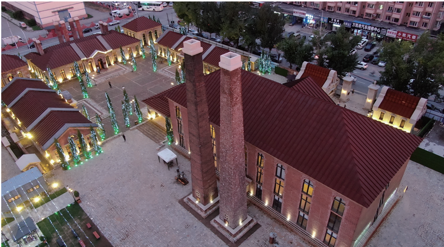
8月20日拍摄的沈阳市奉天工场平台式融合工业园。