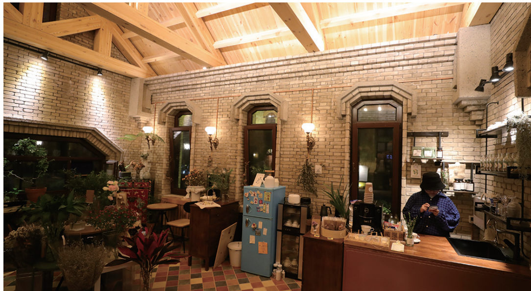
沈阳市奉天工场平台式融合工业园内一家咖啡店。