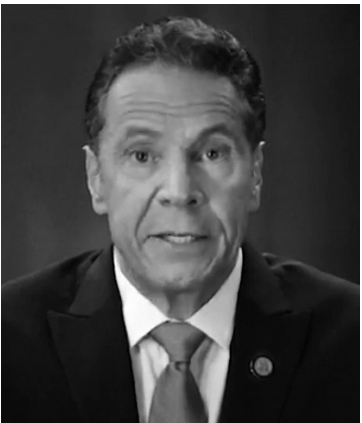
纽约州州长安德鲁·科莫在线出席美国民主党全国代表大会(视频截图)。