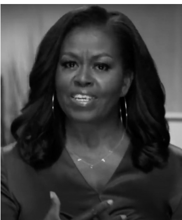
美国前“第一夫人”米歇尔·奥巴马在线出席美国民主党全国代表大会(视频截图)。