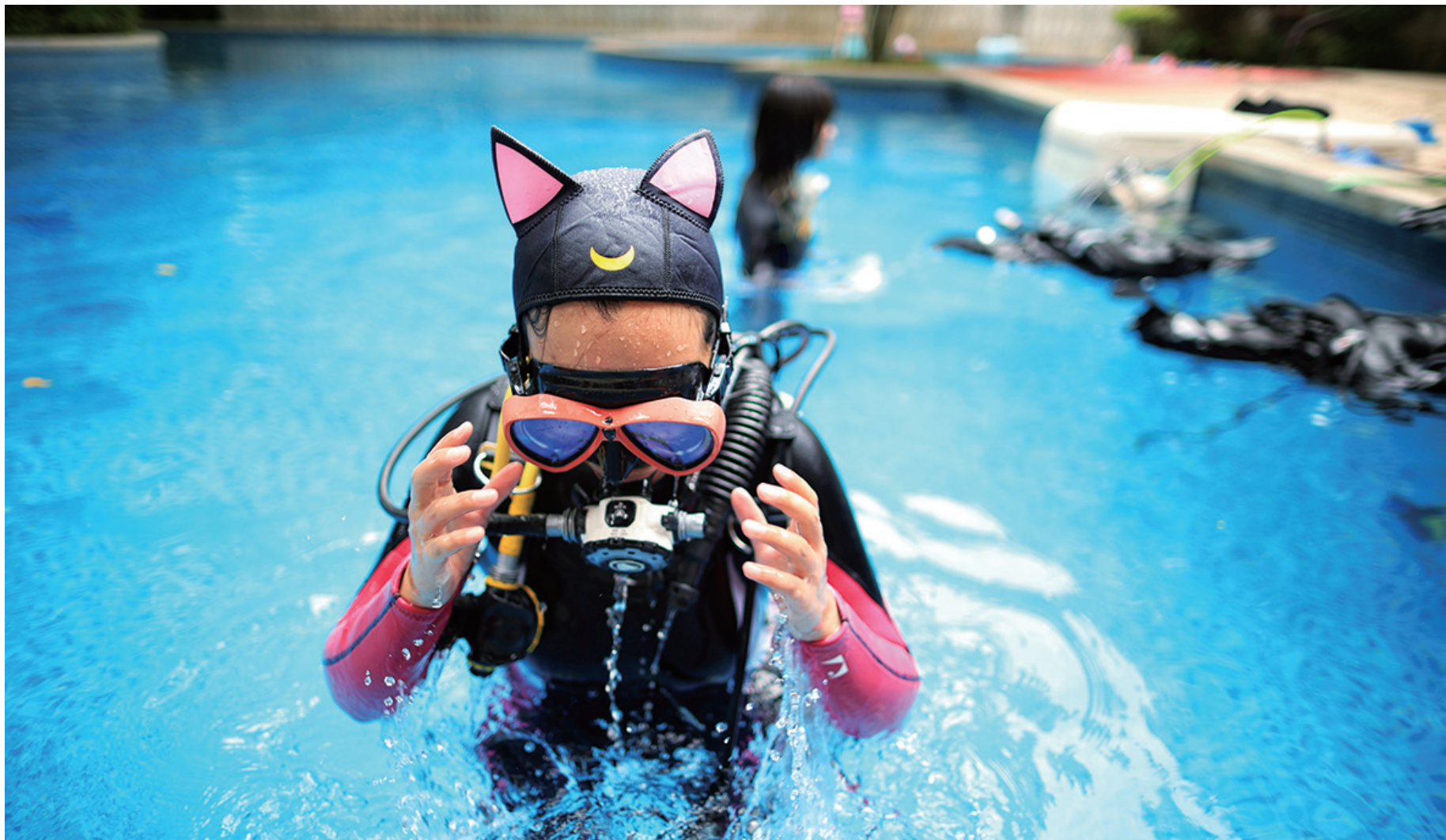
8月17日,在一家俱乐部,一名学员在练习潜水。