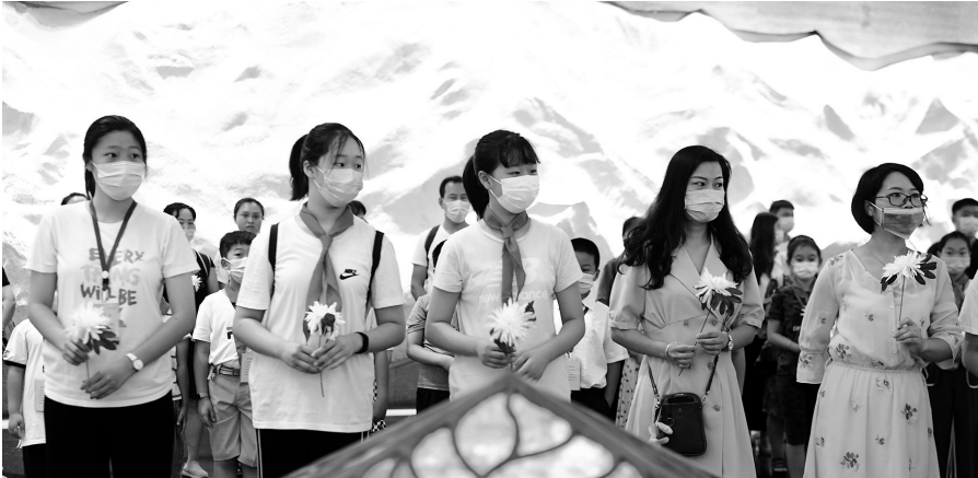
昨日,沈阳“九·一八”历史博物馆举行系列纪念活动。

上午9时,沈阳“九·一八”历史博物馆迎来众多前来参观的游客和学生。人们领取白色菊花,敬献在铭记中国人民14年英勇抗战历程的卧碑前,以表达对抗日英雄的敬意和哀悼。 随后,“和平的种子”主题研学活动正式开始,观众在讲解员的带领下走进展厅,共同参与了“我的英雄我来演”主题互动教育剧,参演教育剧的演员们,都是博物馆的小志愿者,他们通过《九一八之夜》《巾帼英烈》《真相》《中国妈妈》