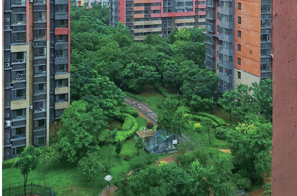
居民小区内,绿意盎然。