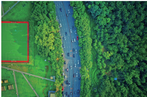
青年大街的车流从绿带中穿过。