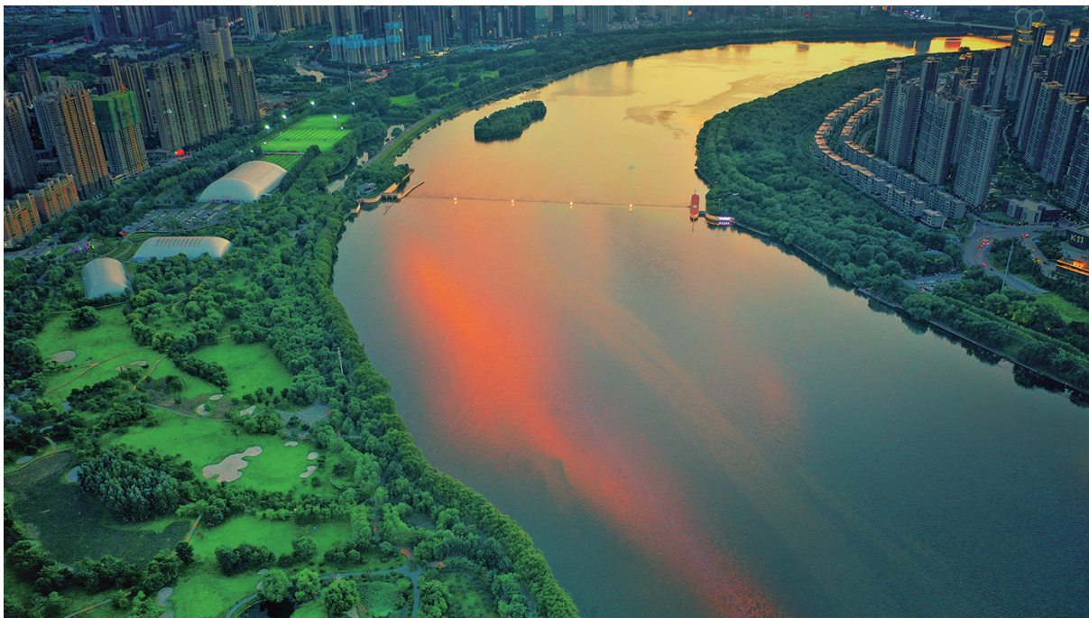
一抹晚霞倒映在浑河的湾流中,红霞与绿树相互映衬。