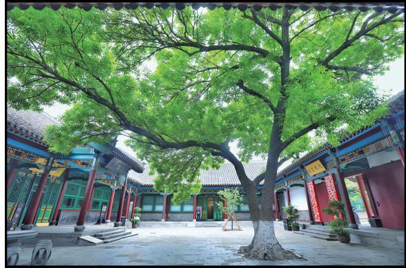
张氏帅府里的四合院,浓荫翠盖,更显清幽。