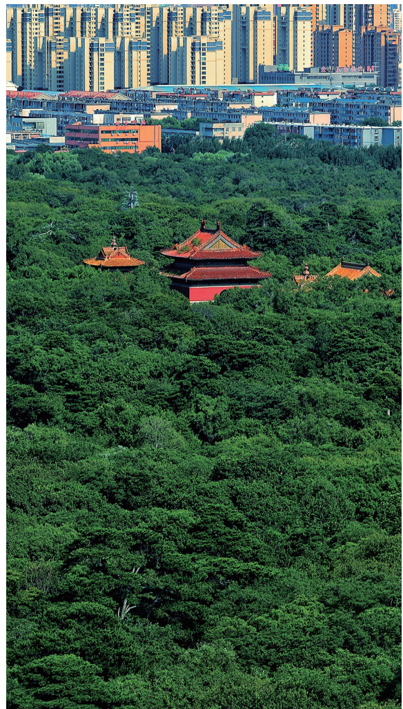
北陵公园的古松林连通着历史与现代。