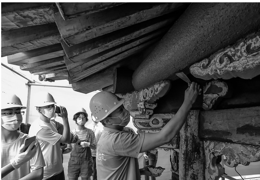
“扫荡灰”也称为通灰,是在“捉缝灰”之后,通身满刮的一道灰,约为3-4mm厚。待干后打磨掉飞翅及浮籽,再打扫干净。

“一麻五灰”从里往外的顺序主要为捉缝灰、扫荡灰、披麻、压麻灰、中灰、细灰,之后还有磨细钻生和血料腻子两道工序。完成“一麻五灰”需要操作近二十道工序。排除雨天等天气因素,在柱子上完成这些工序并上四道油则至少需要60天。