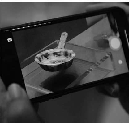
参观者拍摄三彩熨斗。

唐代的社会环境相对宽松、自由,女性敢于大胆追求服饰的自然美,敢于打破“男女不同服”的传统礼法限制,在公开场合着男装。