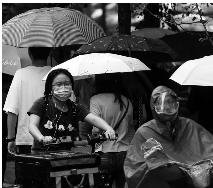
雨水频繁,市民出门需备好雨具。

今天,辽宁将受到台风“黑格比”影响,继续降雨。台风“黑格比”的中心于昨天凌晨在浙江省沿海登陆,这是今年以来登陆我国沿海的第二个台风,“黑格比”登陆后,后期可能继续北上,昨天夜间开始,其外围云系和水汽将持续对辽宁造成影响,根据沈阳中心气象台的最新预报,今天白天沈阳、大连、鞍山、抚