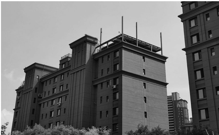
于洪区赤山路“美的城”园区内一户顶楼业主在自己家楼顶“盖楼”。