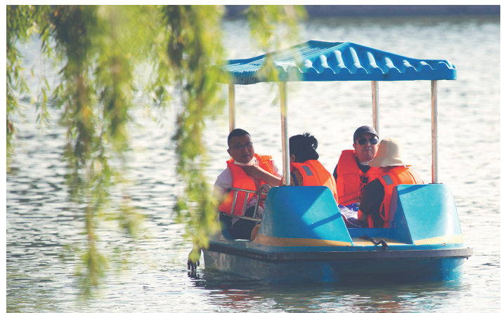
泛舟湖上也是防暑降温的好方式之一。