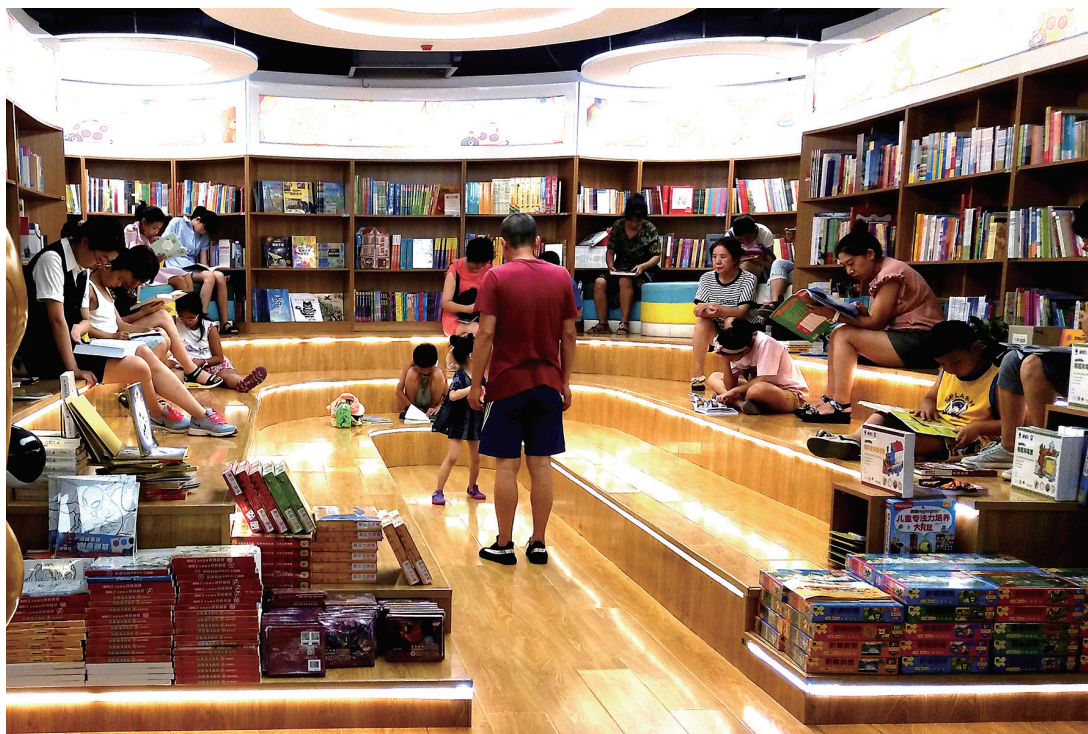
图书馆安静凉爽，不少人在此阅读、乘凉。