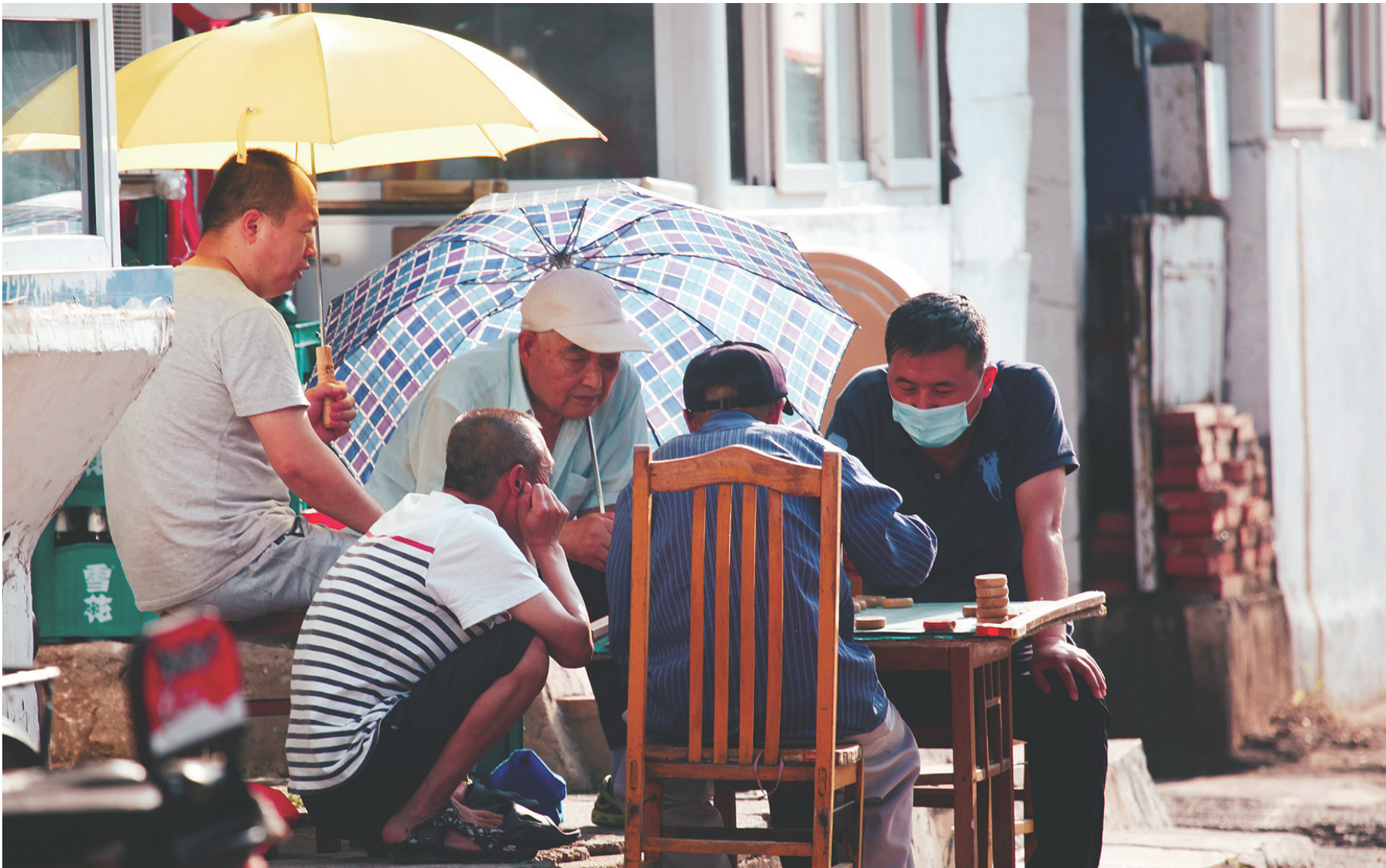
棋友们打着伞对弈。