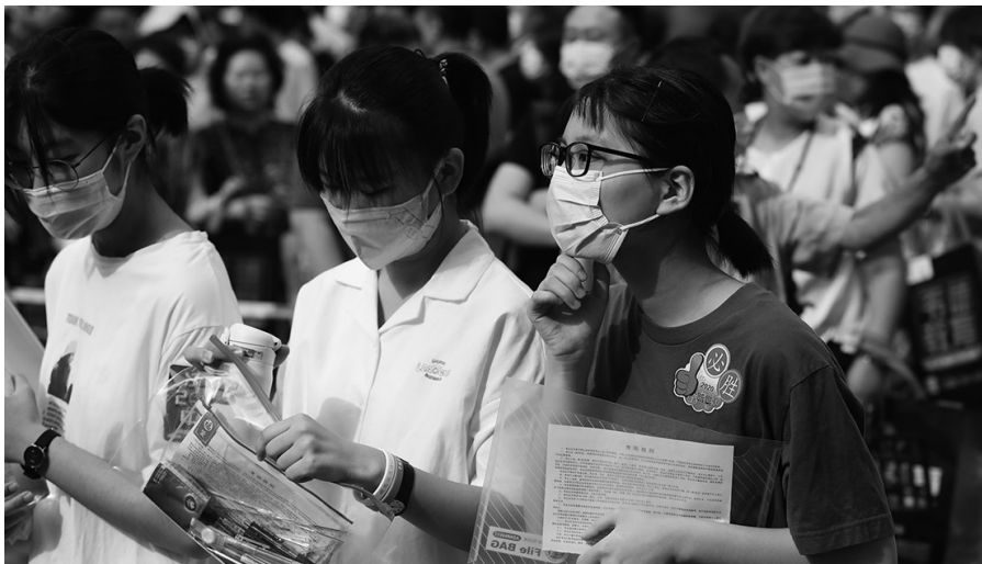
昨日,在沈阳市第二十中学三好校区考点,考生陆续进入考场。

沈阳市、区两级中考联合指挥部成员单位实行现场集中办公,各考区、各部门、各单位持续为考生提供助考服务保障,高效稳妥处置突发偶发事件。公安部门和交通部门为考生提供应急送考服务,卫生健康部门为考生提供医疗救护服务,各相关部门持续加强电网用电保障、噪音干扰整顿、综合环境整治、气象信息预警等保障及监督、检查、指导工作,确保中考安全平稳顺利完成。