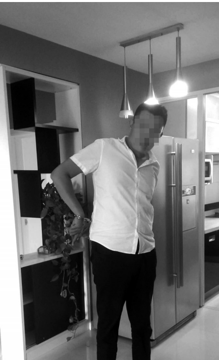
嫌疑人指认作案现场。