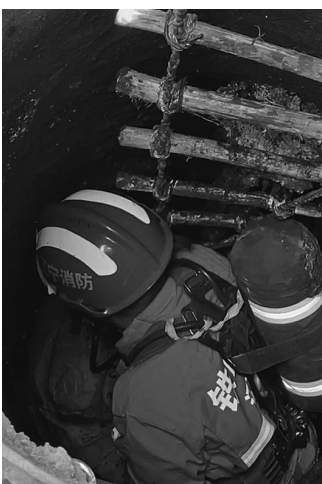
救援人员及时将被困人救出。