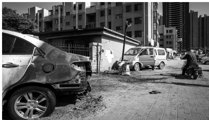
爆炸两天后,仍有一辆烧毁的汽车停在现场。

记者在龙腾碧玉湾小区西墙看到,这里停放着一排机动车,还有几辆做“烤冷面”等食品的小车,一位马姓居民将车停放在此后,对记者讲,“我太幸运了,这地方停车位紧张,晚回来就没地方,那天我的车正好停在