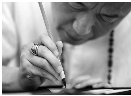
沈阳胡魁章制笔工艺采用手工古法制笔,精工细作、刚柔相济、书写流畅,可达“蘸一墨,书百字”的效果。