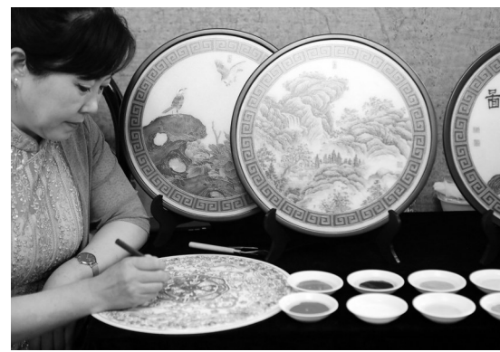
传统的景泰蓝制品多以器皿、瓶罐为主,而凤城景泰蓝水晶画主要在平面作画,强调装饰性。