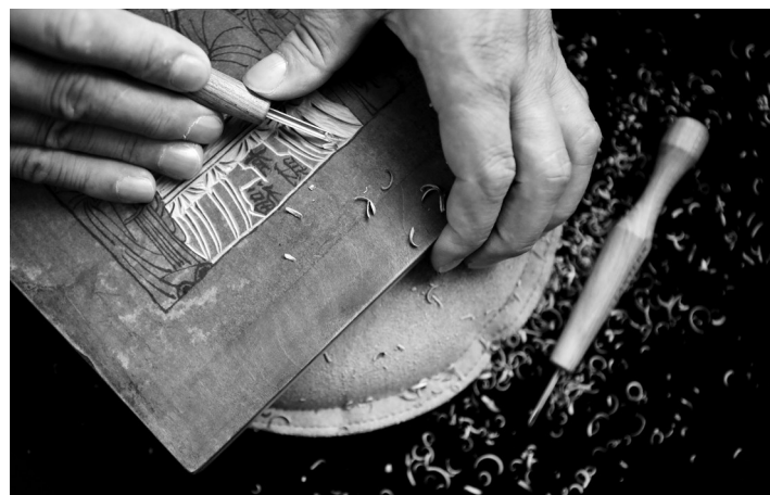
传统木版年画制作。