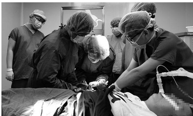
消防人员进入手术室配合医生拆解绞肉机。

在手术室无影灯下,消防员仔细观察后分析了可以进行的几种破拆方式和所需时间,与主治医师研究制定两种救援方案,第一种方法为利用无齿锯,角磨机对绞肉机整体进行破拆;第二种为反向旋转绞