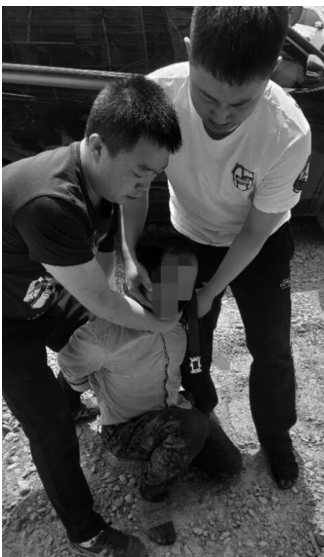
警方抓获绑架犯李某某。

原来,早在2002年12月24日李某某参与了一起绑架案。当日,李某某和另外4名同伙将被害人刘某某绑架到沈阳市于洪区一家