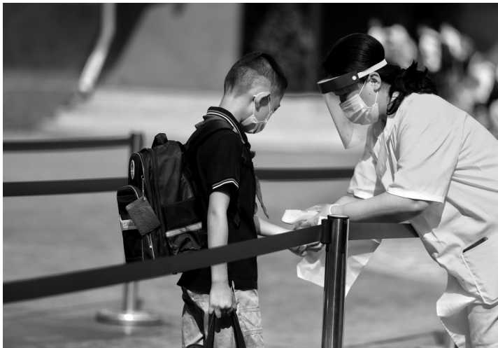
昨日,沈阳铁路实验小学一、二年级学生返校复学。

面对复学的学生,压力最大的莫过于班主任。为了迎接萌娃归来,老师们精心准备,铁路实验小学一年级