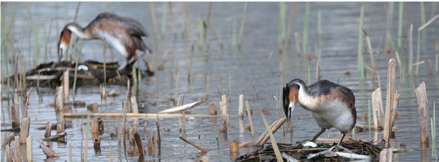
孵化蛋的过程中,不时站起来翻动查看。