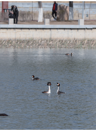
市民在湖边看着它们在湖中觅食、嬉戏。