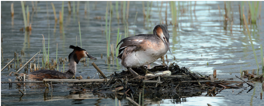
孵化蛋的过程中,它们十分小心。