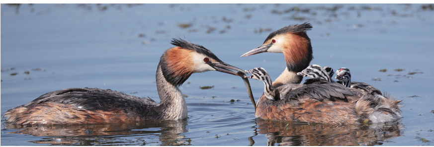
两位鸟家长一个负责遛娃,一个负责捉适合娃吃的小鱼。