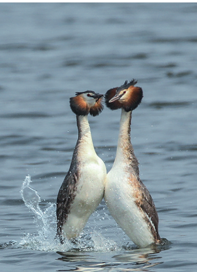
凤头鸊鷉在求偶过程中,在水中跳舞。