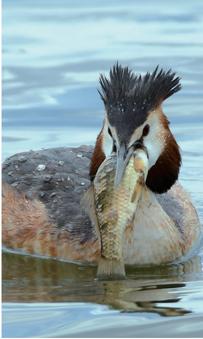
收获了一条大鱼,大快朵颐。