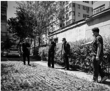
业主称尊龙苑三期为增加停车位,将园区内的部分绿化带和树木移除。