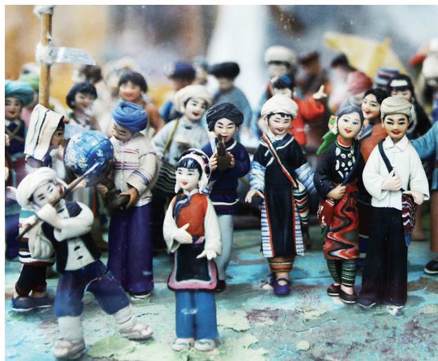
面塑馆里栩栩如生的民族面塑群像。