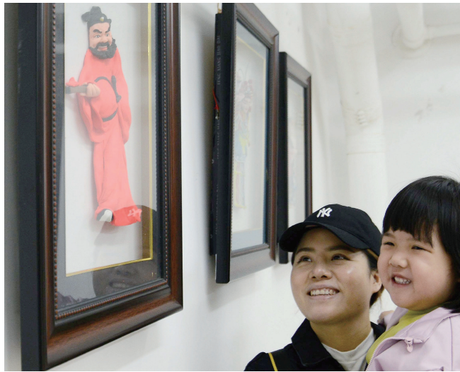
面塑作品让人感受宁静的快乐。