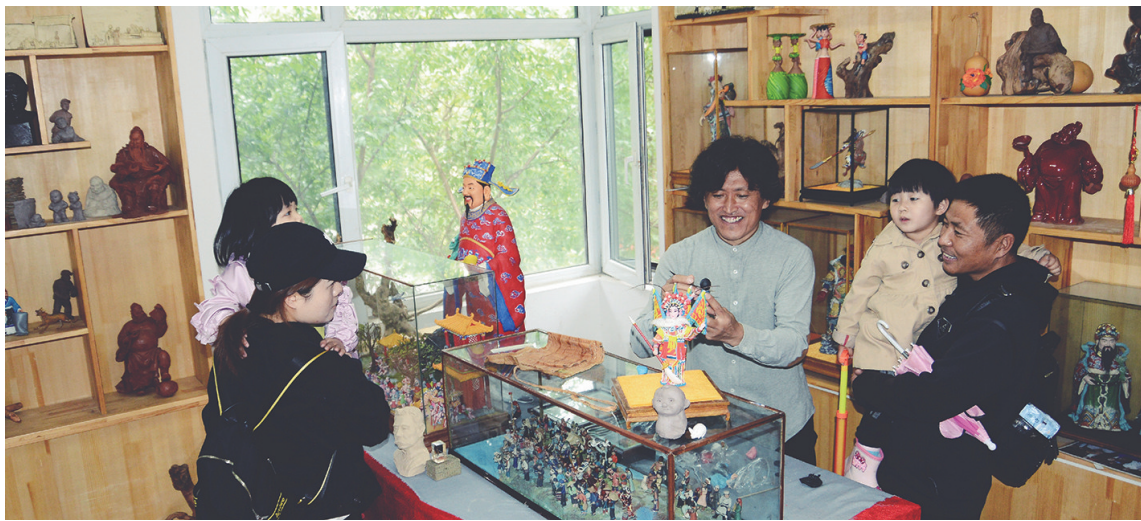
面塑馆是了解传统文化的基地。