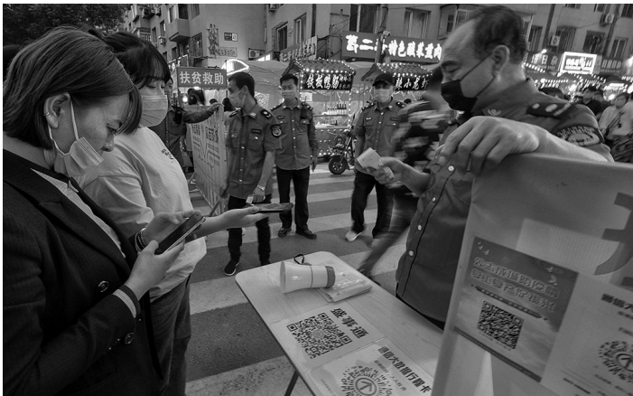
在彩塔夜市,市民在入口处测温、扫码,有序入场。

“很长时间没来,今天就是奔着烤串来的,解解馋。”一位市民笑着说,“这里的卫生也挺好,习惯了三两个朋友坐在一起小酌两杯、聊聊天,放松放松。”