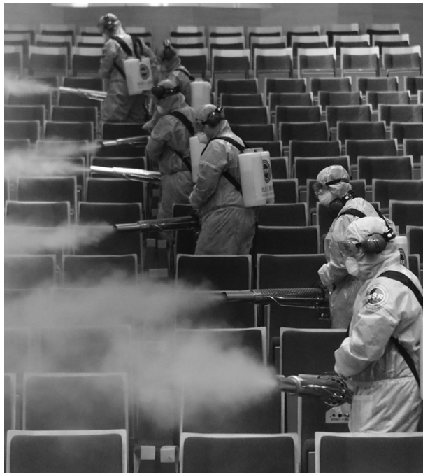
盛京大剧院聘请专业团队对剧院进行防疫消杀。